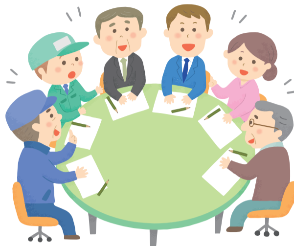
フォーラム=意見交換会のイメージ図

三方フォーラムは、まちづくりの輪を広げながら、近い将来角がり角に差し掛かる日野の現状を知っていただき、たくさんの人に町政に関心を持っていただくように活動します。